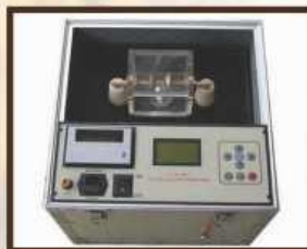
Insulating Oil Tester